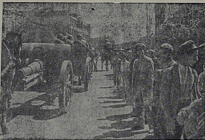
Советские войска в Иране.

Танковая группа Гудериана, потеряв таким образом 2/3 своих танков оказалась далеко отброшенной от Брянска.